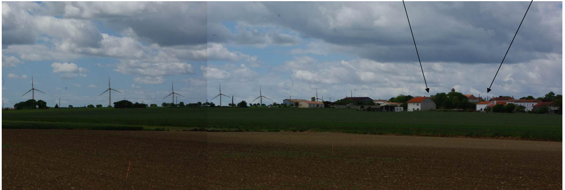
Les machines de Villeneuve se positionneraient en fond de décors de l'église de La Croix Ctesse.

Ce parc conduit à une dégradation du Patrimoine commun