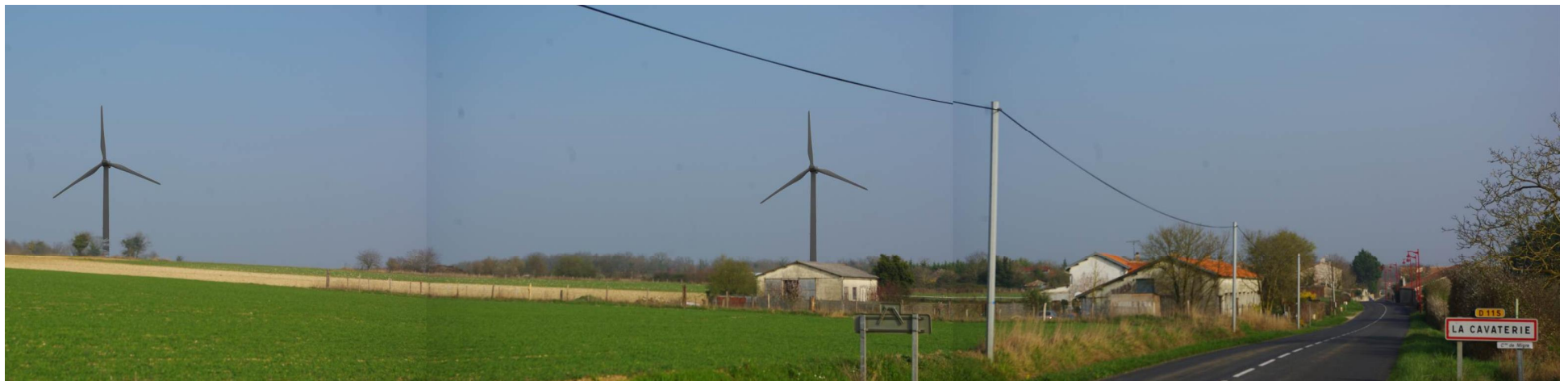
A la Cavaterie