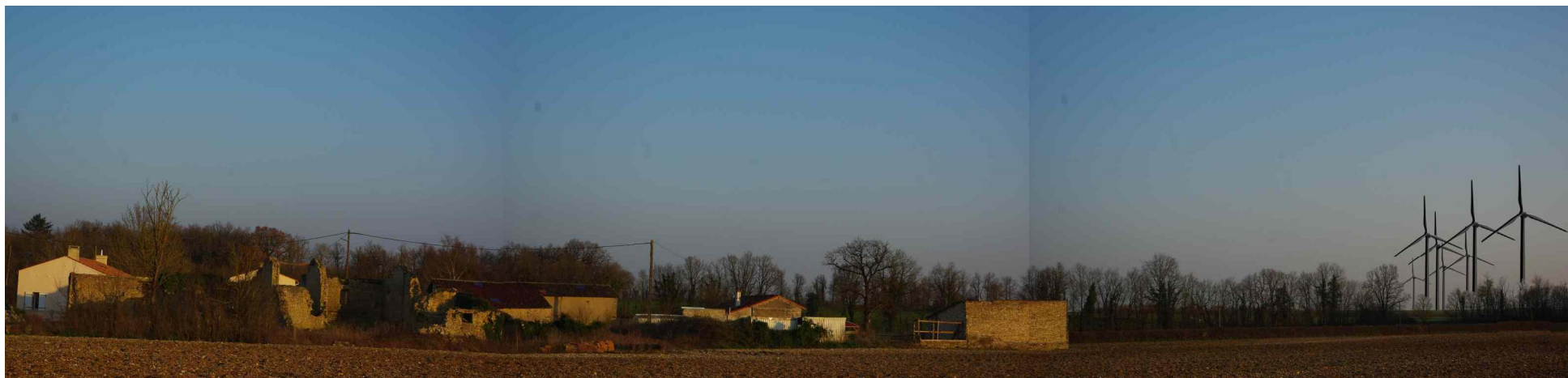
A la Brousse