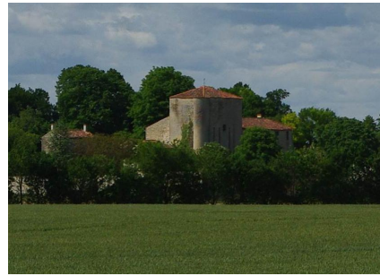
Château de Villeneuve la Comtesse