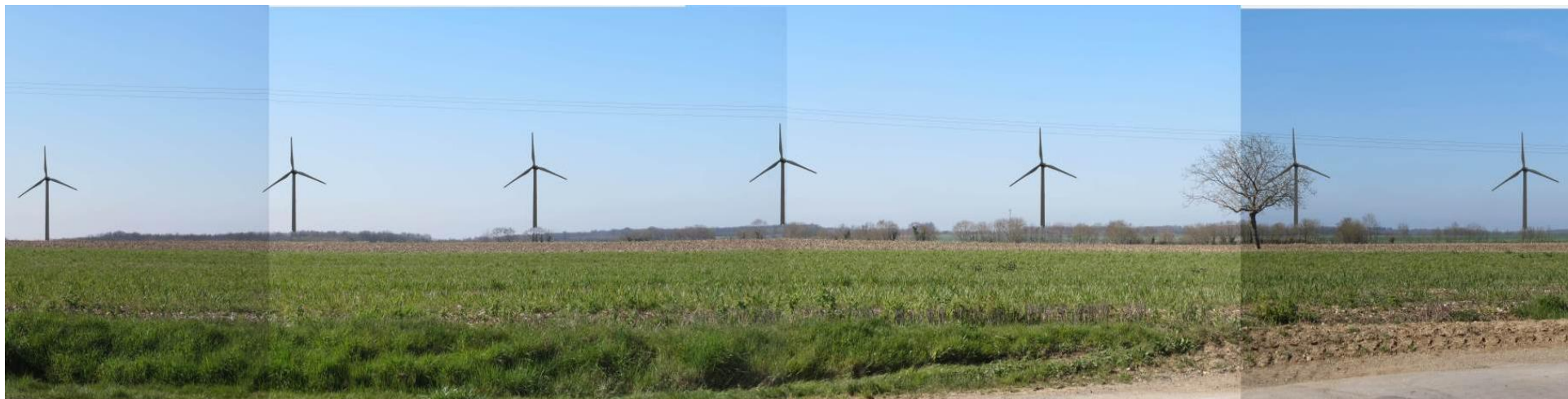
A Villeneuve la Comtesse

Plusieurs dizaines de personnes de Villeneuve la Comtesse, La Croix Comtesse, Vergné La Cavaterie etc ... seraient fortement touchées par la présence sans obstacle de toutes les éoliennes depuis les fenêtres de leurs maisons: