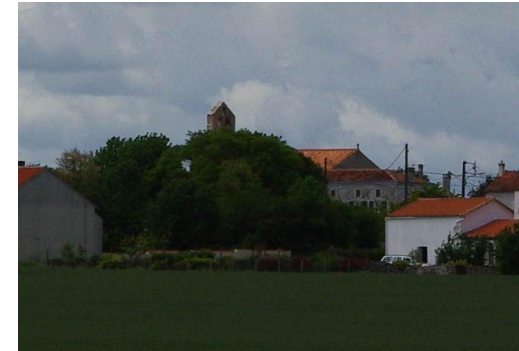
L'église romane Saint Révérend de La Croix Comtesse