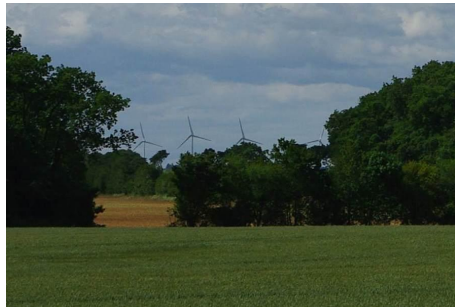
Eoliennes industrielles de La Benate

Le site industriel et les nombreux autres déjà en place ou à venir, dégraderaient l'environnement de patrimoine commun culturel :