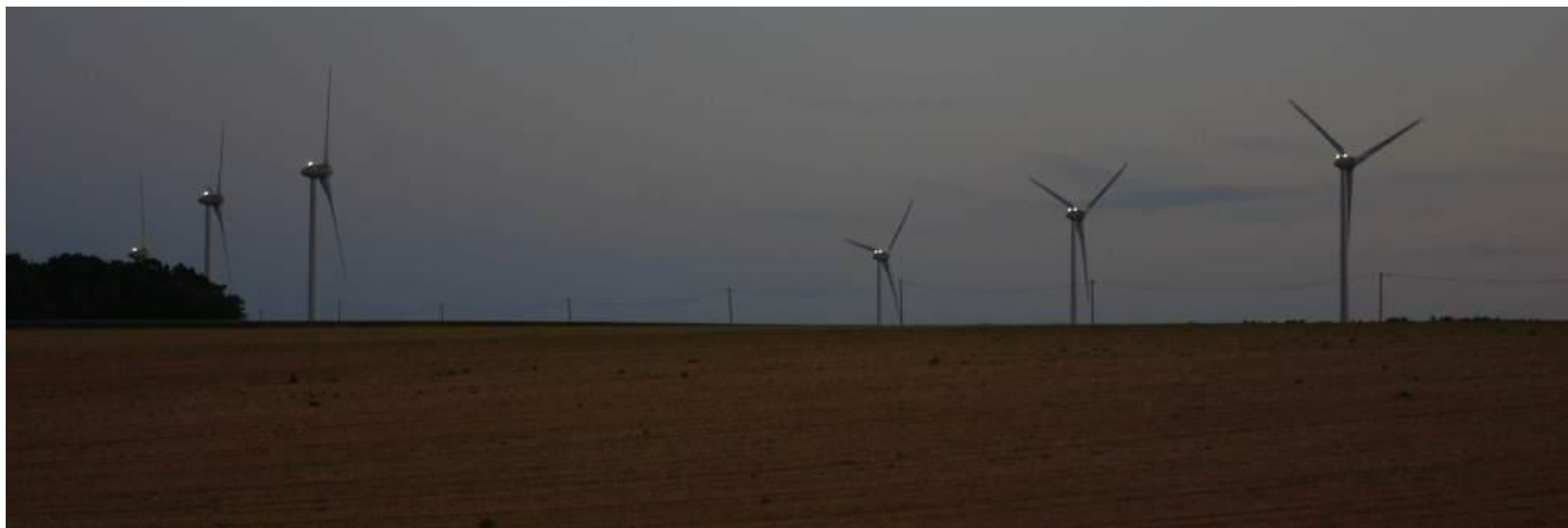
(Eclats lumineux des éoliennes du site industriel de La Benate à 8 km de Villeneuve la Comtesse)

Les riverains considèrent que la présence de ces machines industrielles nuit à leur qualité de vie (agitation, bruit, clignotements lumineux blanc et rouges diurnes et nocturnes...) :