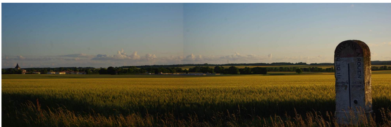
Plaine de Villeneuve la Comtesse vue du nord à la frontière départementale entre la Charente Maritime et les Deux-Sèvres. Le clocher de Villeneuve la Comtesse apparaît à l'extrême gauche de la photographie.

Le clocher de l'église et le donjon du Château de Villeneuve la Comtesse font chacun environ vingt mètres de hauteur. Tous deux s'intègrent de manière discrète et non agressive dans ce paysage à l'image du tempérament paisible du Charentais.