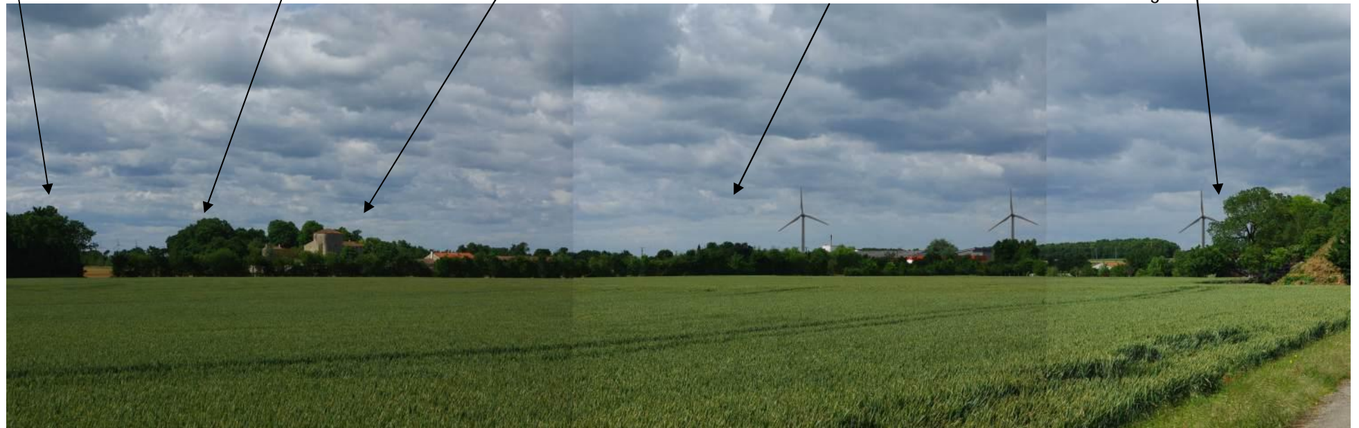
Eoliennes industrielles de Villeneuve la Comtesse et Vergné

De nombreuses machines se positionneraient en fond de décors du Château de Villeneuve la Comtesse.