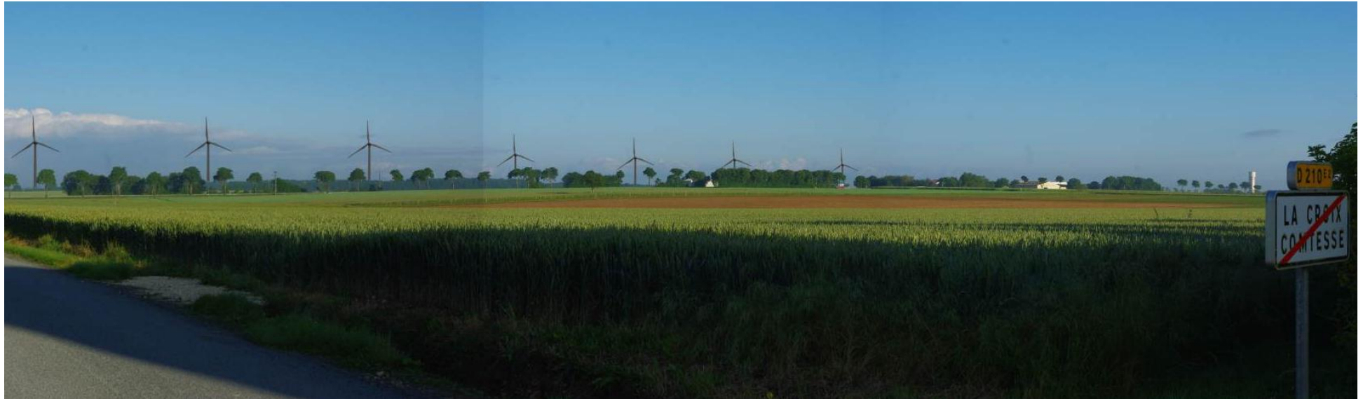
A La Croix Comtesse